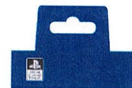
WIRED USB MICROPHONE

S.A. au capital de 31 744 832 Euros Rue de la voyette - CRT 2 59818 LESQUIN CEDEX RCS LILLE B 320 992 977 Tél : 03 20 90 72 00 Fax : 03 20 87 57 99